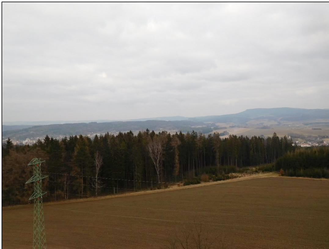
Pohled na okrsek z rozhledny Signál – zalesněné svahy a sídlo Hronova